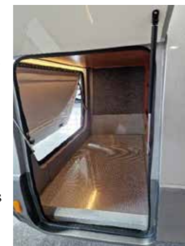
Heckgarage von S690 DB, S691 DB, S691 EB, S770 DB, S770 EB & S770 QB

Unsere riesige beheizte Heckgarage mit einer Länge und Breite von 1,05 m x 2,10 m, besitzt eine Traglast von 250 KG, die Höhe der seitlichen Heckklappe beträgt 1,23 m und die Breite beträgt 0,81 m. Hier finden Fahrräder, elektrische Fahrräder oder ein kleines Motorrad ohne Problem Platz. Zusätzlich besitzt der WANNER SILVERDREAM neben der seitlichen Heckklappe auch eine hintere Heckgarage, so können Sie auch zugeparkt an Ihre Heckgarage. Der Boden der Garage wird durch ein Aluminium Riffelblech geschützt, diese sorgt mit der groben Riffelung, dass Ihr Heckgepäck nicht umherrutscht. Auch der Außenduschanchluss befinden sich in der Heckgarage.