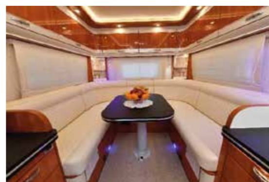
Silverdream S690 RS / S770

Unsere riesige beheizte Heckgarage mit einer Länge und Breite von 1,05 m x 2,10 m, besitzt eine Traglast von 250 KG, die Höhe der seitlichen Heckklappe beträgt 1,23 m und die Breite beträgt 0,81 m. Hier finden Fahrräder, elektrische Fahrräder oder ein kleines Motorrad ohne Problem Platz. Zusätzlich besitzt der WANNER SILVERDREAM neben der seitlichen Heckklappe auch eine hintere Heckgarage, so können Sie auch zugeparkt an Ihre Heckgarage. Der Boden der Garage wird durch ein Aluminium Riffelblech geschützt, diese sorgt mit der groben Riffelung, dass Ihr Heckgepäck nicht umherrutscht. Auch der Außenduschanchluss befinden sich in der Heckgarage.